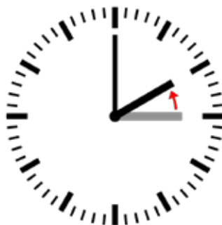
Omställning till vintertid